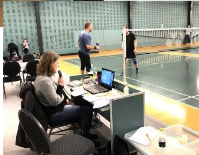
Der er også et par fotos på bagsiden