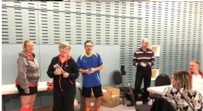
Der var deltagere fra Brøndby denne gang