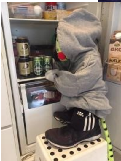
Spirillen er blevet teenager