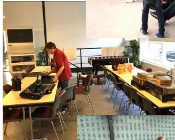
Præmierne gøres klar