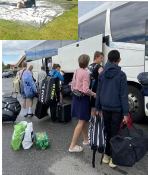
Klar til afgang