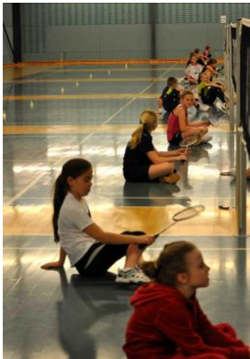
Klar på banerne Se også forsidebilledet

Ved midnat var det så godnat, sådan da. Det er et fantastisk syn at se cafeen og kontoret lavet om til sovesal for knap 30