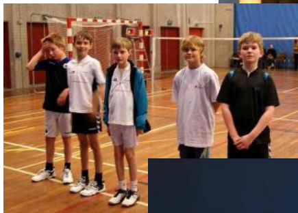
Der ventes på diplomer