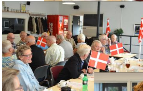
Fødselsdagsstemning på 60+ holdet