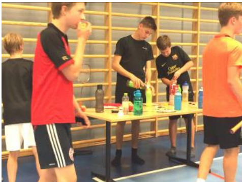
Skal man træne, skal depoterne fyldes op

Et par billeder fra ungdommens træningslejr. Læs på side 11 !