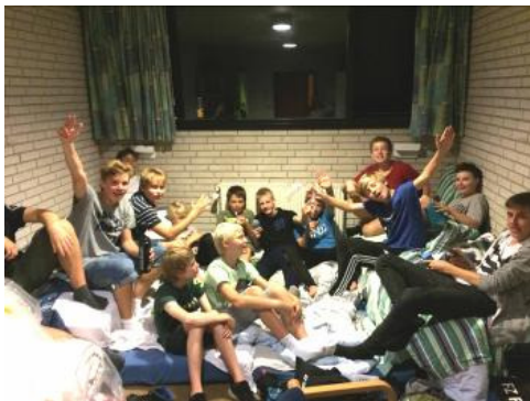
Hygge på værelset