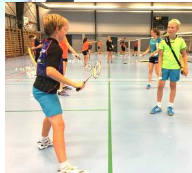
Mere ungdomsnyt på bagsiden....