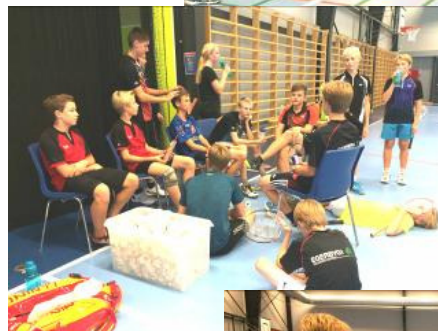
Så er der pause