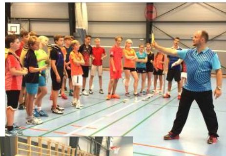
Instruktion i lækker baghånd