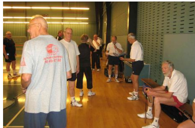
Så er der udkald til banerne...