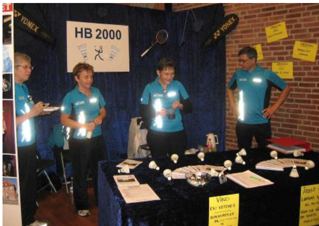
Her har vi stand-besætningen i fin HB 2000 "uniform"

Ved standen havde vi opstillet en spand, hvori man skulle ramme med så mange fjerbolde som muligt, fra en fast afstand. To gange på dagen var der en præmie til den der havde rekorden.