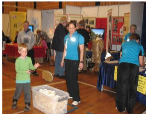
En ny Peter Gade ?