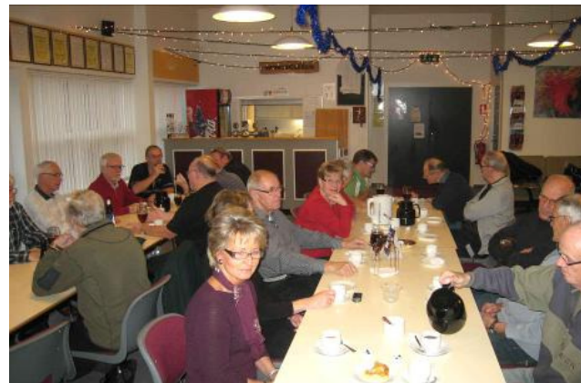
Hygge ved kaffebordet