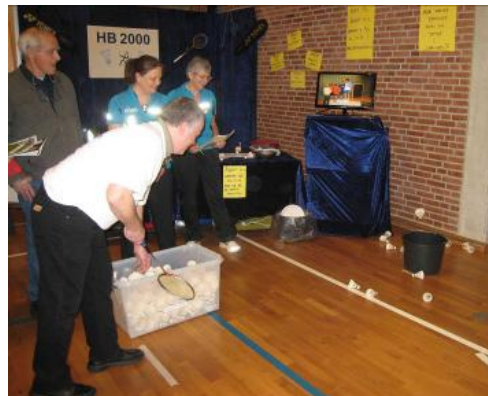
Det var ikke så let, men her er bolden på vej ned i spanden

Vi håber at vor deltagelse i messen, på længere sigt, kan højne interessen for badminton i almindelighed og HB 2000 i særdeleshed.