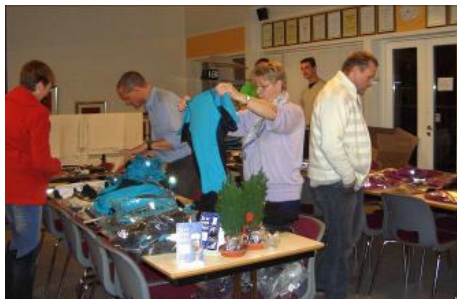
Som billederne viser var der godt besøg og stor interesse for såvel tøj som ketsjere

Aftenen var en kæmpe succes med masser af interesserede medlemmer og gode tilbud. Vi er derfor allerede i dialog med Ketchergalleriet om at lave endnu en aften i 2011.