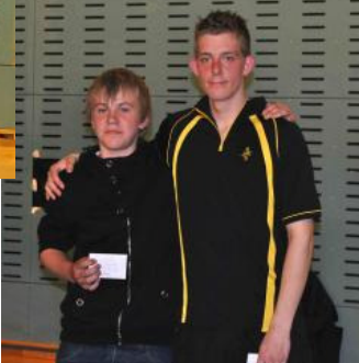
Et lille udpluk af glade klubmestre