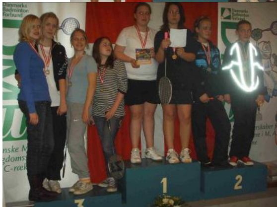
DD i U15 c-rækken

Så det var nogle stolte spillere der vendte næsen hjemad søndag eftermiddag. Det var trætte spillere der blev hentet af forældrene på Friheden st. kl. 21.00. Men det var en god og sjov oplevelse at være med. Det lægger højst sandsynligt op til en gentagelse næste år.