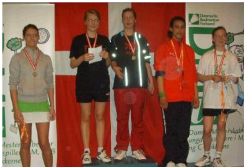
DD i U15 b-rækken