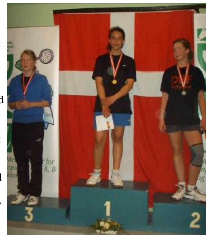
DS i U15 b-rækken