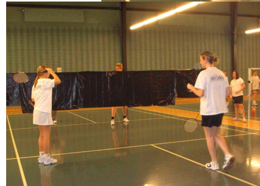
En ny slags net !