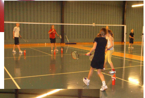
Nisser på spil