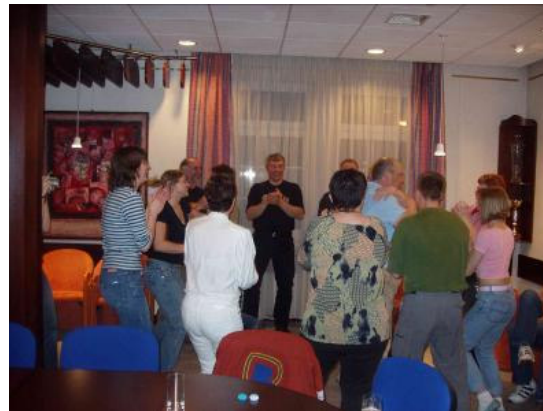
Og så blev der danset på tjekkisk!