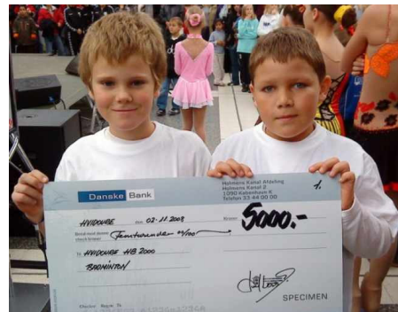
To stolte "legatmodtagere"

Sammen med de 15 andre udvalgte foreninger fik vi overrakt kr. 5000 af Hvidovres borgmester, Milton Graff.