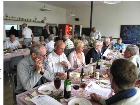
En festlig stund i 60+