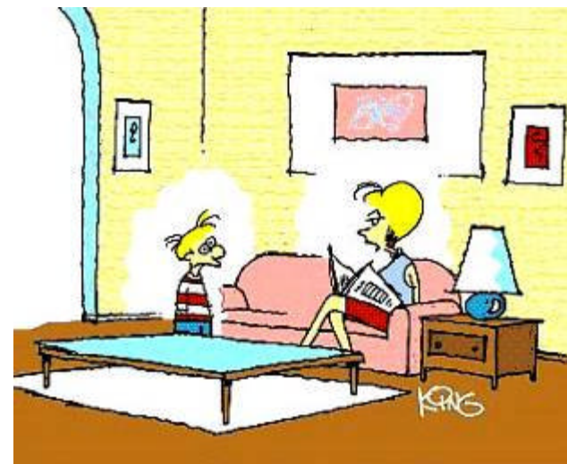
Mor, jeg tror altså ikke på det der med storken.... - jeg ved godt at jeg blev downloaded !