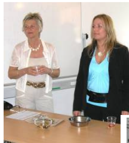
"Velkomstkomiteen" ved festen