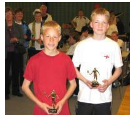
Et par stolte præmiemodtagere....