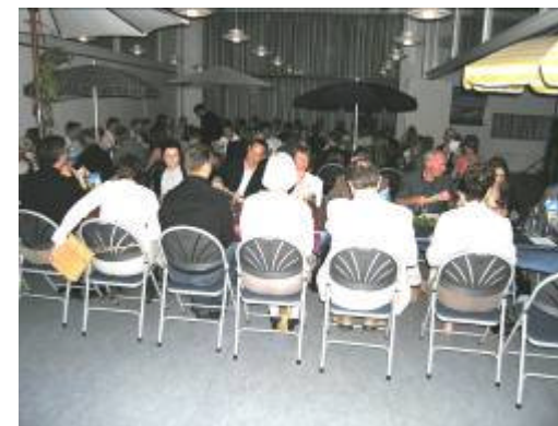
Der var godt fyldt op !