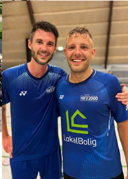
Fotos fra seniorennes træningslejr